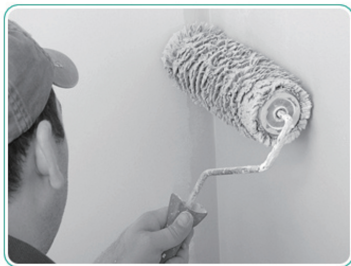
ホルムアルデヒド