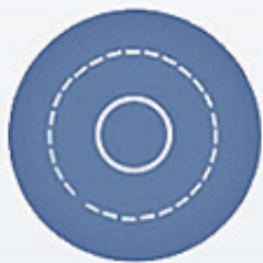
セラミック噴霧シート