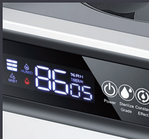
タッチ式デジタル画面