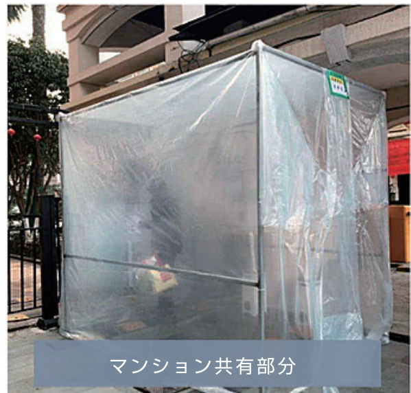
マンション共有部分