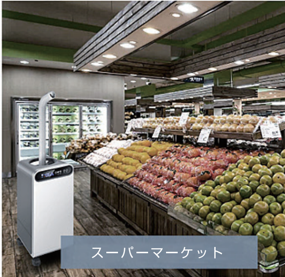
スーパーマーケット