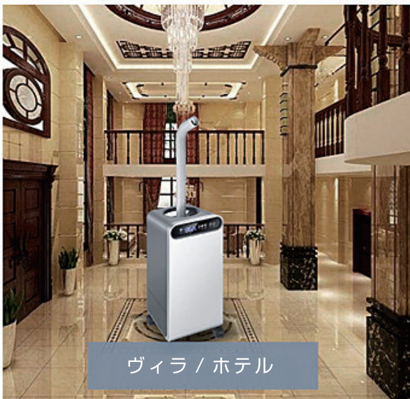
ヴィラ / ホテル