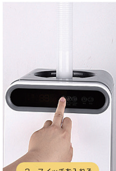
3. スイッチを入れる