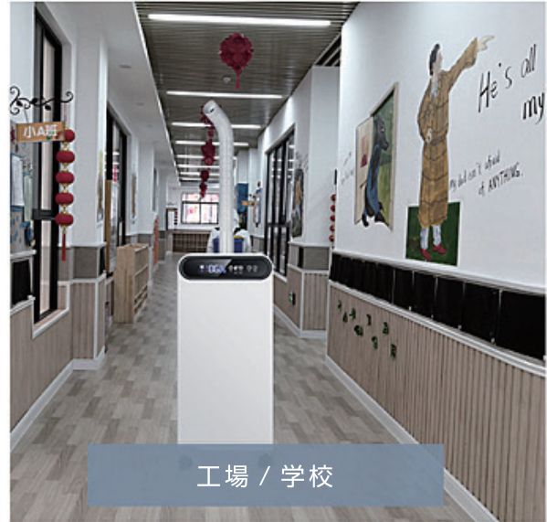
工場 / 学校